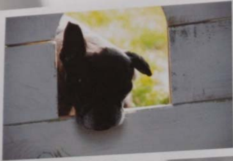
Even het kippenhok bekijken.