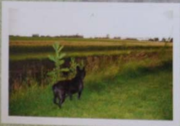
IJspret.. Spelen en kroelen met Basco en genieten van mijn leventje in Piershil!